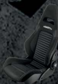
Fotele Sabelt - tapicerka materiałowa czarna (8RS)