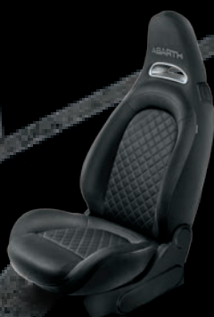
Tapicerka materiałowa czarna - wzór w romby (8E7)

■ wyposażenie standardowe; – opcja niedostępna