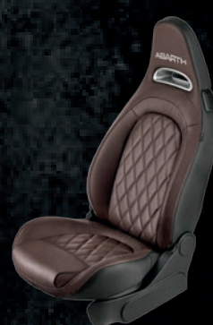
Tapicerka skórzana w kolorze brązowym Helmet (8RX)