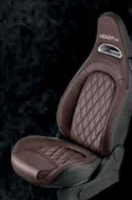
Tapicerka skórzana w kolorze brązowym Helmet (8RX)