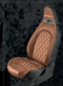
Tapicerka skórzana w kolorze brązowym (8K1)