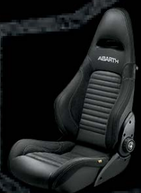
Fotele Sabelt GT - tapicerka skórzana czarna / Alcantara (4FA)