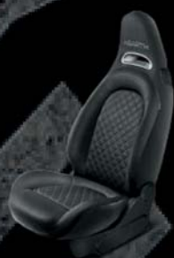
Tapicerka materiałowa czarna - wzór w romby (8E7)

■ wyposażenie standardowe; - opcja niedostępna; * - dla 595C