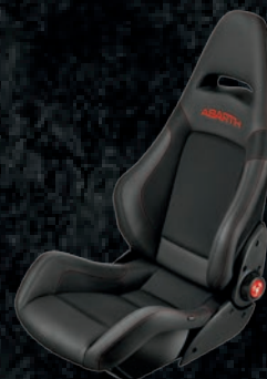
Fotele Sabelt Racing Carbon czarne (8RU)