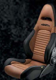
Fotele Sabelt GT - tapicerka skórzana brązowa / Alcantara (8RT)