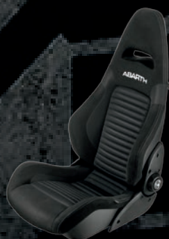
Fotele Sabelt - tapicerka materiałowa czarna (8RS)