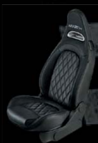
Tapicerka skórzana w kolorze czarnym (50J)