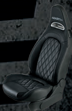
Tapicerka skórzana w kolorze czarnym (50J)